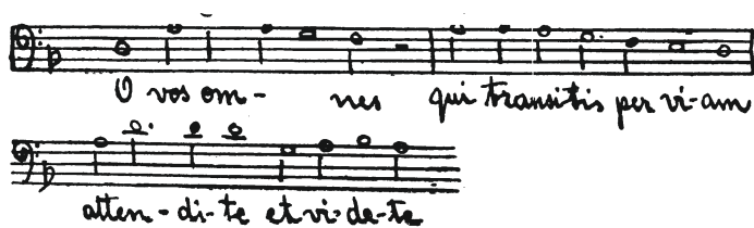
Fig. 32. — Un motiv Vitorian (după V. d'Indy)

atât de puternice, încât până azi ele rămân capabile de a îndemna și inspira pe compozitorii cei mai de seamă. Născut în 1540 (la Avila) el vine timpuriu la Roma unde își începe fecunda-i activitate, caracterizată prin acele teme superbe, prelucrate într'un stil cu totul corespunzător.