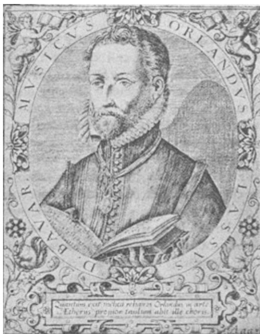
Fig. 34. — Roland de Lattre

maestru de cor la biserica St. Giovanni a Laterano. Mai târziu vizitează și Anglia, Franța, iar în timpul șederii sale la Antwerpen, unde publică primele Madrigale, face cunoștință cu multe personaje din cele mai marcante ale timpului său. Recomandației unuia din aceștia (Fugger) îi datorează și chemarea la München, la curtea ducelui Albrecht al V-lea al Bavariei, devenind acolo în 1562 șef de capelă, funcțiune în care rămâne până la moarte.